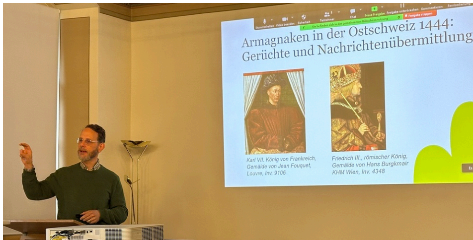
Arman Weidenmann